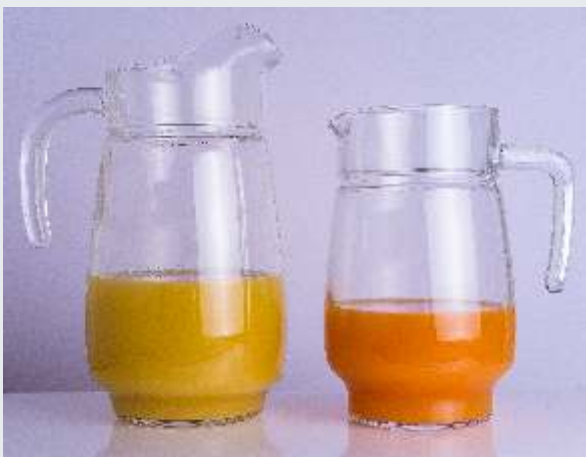
Arcoroc Krug Tivoli 1,6 und 2,3 Liter (TR-ARC-07058-1 und TR-ARC-28438-1)

Eingeschenkt mit Schwung und Stil, genug für die ganze Familie. Frischer Obstsaft oder Wasser, daheim auf dem Tisch für den großen Durst an warmen Tagen oder im Hotel und Restaurant am Buffet.