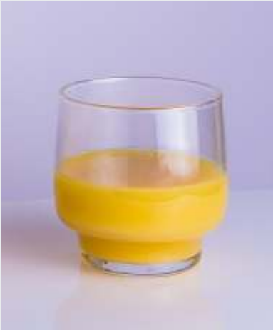
Luminarc Saftglas Tivoli 250 ml (TR-ARC-J7515-3)

ExtraTrade bietet erstklassige Produkte renommierter Markenhersteller zu guten Konditionen an. Ob für private Endverbraucher, Großkunden oder Unternehmen - Produkte für nahezu jede Gelegenheit und Anlass stehen für Sie bereit. Am Morgen oder Abend, mit Stil und Charme servieren Sie sich und Ihren Gästen mit unseren Produkten auch ein Stück Lebensqualität.